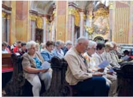
Beim Mittagsgebet in der Stiftskirche

Bei unserem Ausflug nach Melk feierten wir den Gottesdienst in der Sommersakristei des Stiftes, ein tiefes Erlebnis für alle Teilnehmer. Nach einem kurzen Rundgang beteten wir mit den Mönchen das Mittagsgebet (None) in der Stiftskirche.