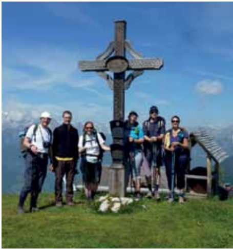
Die Gruppe auf der Bischlinghöhe (1834 m)

Unsere heurige Fußwallfahrt führte uns ins schöne Salzburger Land: Wir pilgerten drei Tage lang am Fuße des Tennengebirges in den idyllischen Urlaubs- und Marienwallfahrtsort WERFENWENG. Trotz Schlechtwetters erklimmen wir die Werfener Hütte, die wie ein Adlerhorst über das Salzachtal wacht. Über die Wengerau erreichten wir nach Wetterbesserung die H.-Hackl-Hütte, wo wir an einem besonderen Erlebnis teilnehmen konnten - Sonnwendfeuer in den Bergen! Über die Bischlinghöhe (Foto) erreichten wir am Sonntag unser Ziel, die Pfarrkirche Werfenweng. Schön war's! ■