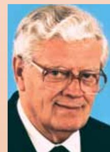
Ihr Prälat Friedrich Guttenbrunner

Unser Papst sagte vor kurzem: „Ein echter Christ ist ein Mensch mit Freude im Herzen, denn die Freude gehört zu den wichtigsten Kraftquellen eines Menschen.“